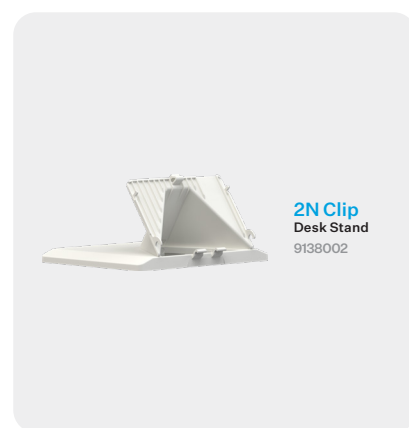
2N Clip Desk Stand 9138002